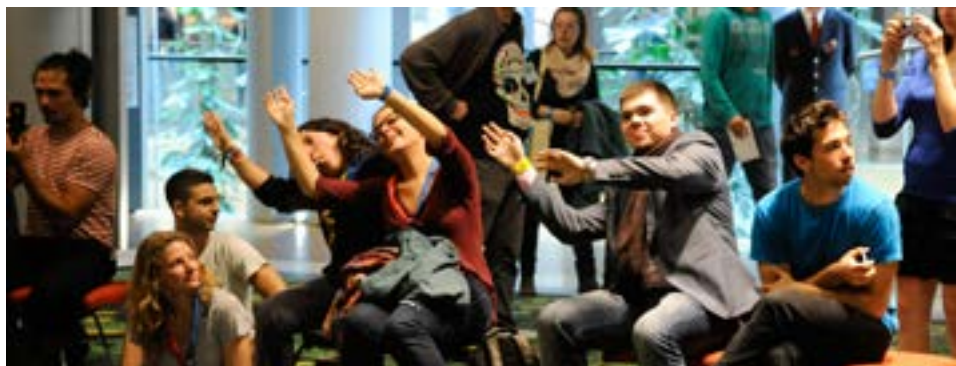
Des participants regardant et appréciant le spectacle au bar des fleurs