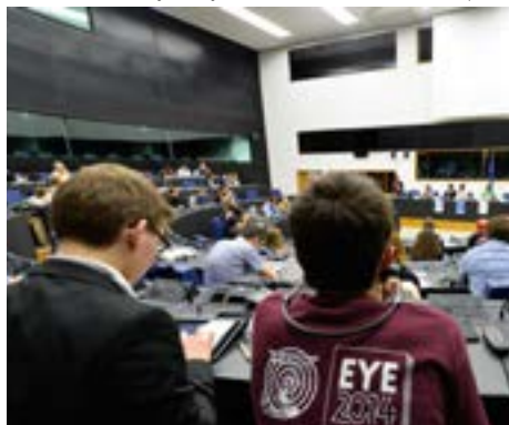
Des jeunes journalistes (EYMD) écoutant un panel

référence devrait même être intégré dans les cursus universitaires.»