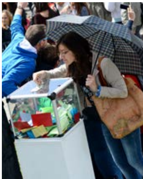
La boîte à idées se remplit au fur à mesure de propositions pour une Europe meilleure

En début d'après-midi, alors que les participants s'apprétaient à partir, plusieurs questions demeuraient sans réponse. Pourquoi tant de députés au Parlement européen avaient-ils annulé leur participation aux débats? Où était le Président du Parlement européen, Martin Schulz? Qu'était-il arrivé à la diversité de l'Union européenne – un concept souvent abordé dans les activités, mais qui n'a pas toujours été évoqué par les intervenants? Après trois journées d'intenses discussions, il était évident que les jeunes participants souhaitaient s'engager dans la politique européenne, et si nombre d'idées pertinentes pour une Europe meilleure ont été proposées par les quelque 5 500 participants au cours de l'événement, c'est aux députés élus qu'il incombe maintenant de les mettre en œuvre.