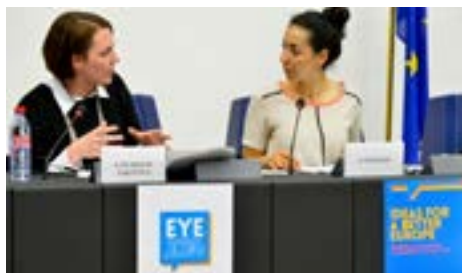
Des jeunes députés en train de discuter avec les participants les «villes intelligentes» de leurs rêves

«Parfois nous sommes trop paresseux pour nous déplacer vers le bureau de vote, ou bien nous travaillons toute la journée et ne pouvons tout simplement pas voter, même si nous le souhaitons. De nos jours, il est possible d'accomplir plusieurs tâches dans un environnement en ligne sécurisé, comme des opérations bancaires. Les pays européens devraient donc rendre possible le vote en ligne ou par smartphone, même si l'on est à l'étranger», a