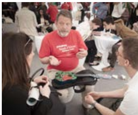
Bibliothèque vivante sur les expériences de discrimination organisée par le Conseil de l'Europe

Le Parlement européen s'est fixé comme objectif de promouvoir les droits de l'homme à travers le monde, de protéger les minorités et de promouvoir les valeurs démocratiques (notamment en ce qui concerne la liberté d'information et la liberté de la presse). À l'heure de la révolution des médias numériques, la situation ne cesse d'évoluer actuellement; de nouvelles méthodes visant à restreindre la liberté de pensée voient le jour, de même que de nouveaux moyens de contourner ces restrictions.