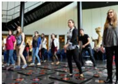
Des participants expérimentent la machine iDance ou comment le fitness peut s'allier avec les technologies

La cybercriminalité a indéniablement changé le droit, non seulement au niveau des États