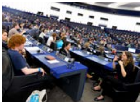
La langue des signes à EYE 2014

Grâce aux concerts gratuits du YO!Fest organisés au centre-ville de Strasbourg et dans le quartier du Wacken, la rencontre EYE a touché bien plus que les 5 500 participants, puisque ces concerts ont attiré 4 500 personnes supplémentaires au Parlement européen et au Forum de la jeunesse. Les concerts ont été le moyen d'attirer