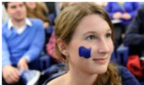
Une joue colorée pour un week-end très en couleurs

gouvernement central pour les pays de la zone euro: