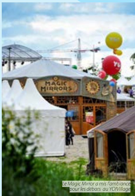
Le Magic Mirror a mis l'ambiance pour les débats au YO!Village

Les schémas de consommation et de production non durables ne peuvent plus durer. Il incombe, en particulier, à l'Union européenne de prendre des mesures, étant à l'origine d'une part disproportionnée de la consommation mondiale. Il est nécessaire d'éduquer les consommateurs de façon urgente. Ceux-ci doivent prendre davantage conscience de leurs responsabilités et des conséquences d'une surconsommation de l'énergie et des ressources. Parallèlement, il convient de promouvoir en priorité d'autres schémas garantissant davantage d'efficacité et une distribution plus équitable de la consommation. Les organisations de jeunesse, qui utilisent la voie éprouvée et efficace de l'éducation informelle comme vecteur de changement social, ont un rôle déterminant à jouer dans ce contexte.