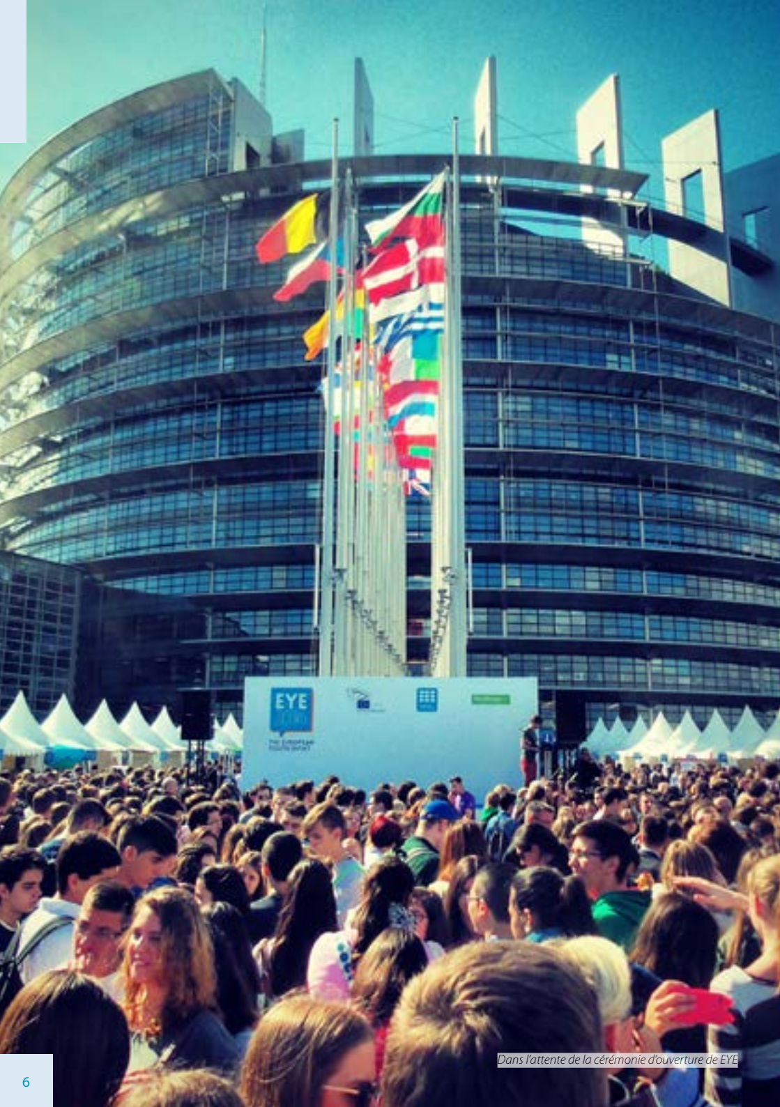
Dans l'attente de la cérémonie d'ouverture de EYE