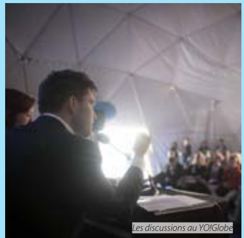
Les discussions au YO!Globe