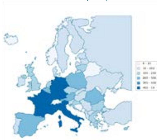
Nationalités des participants