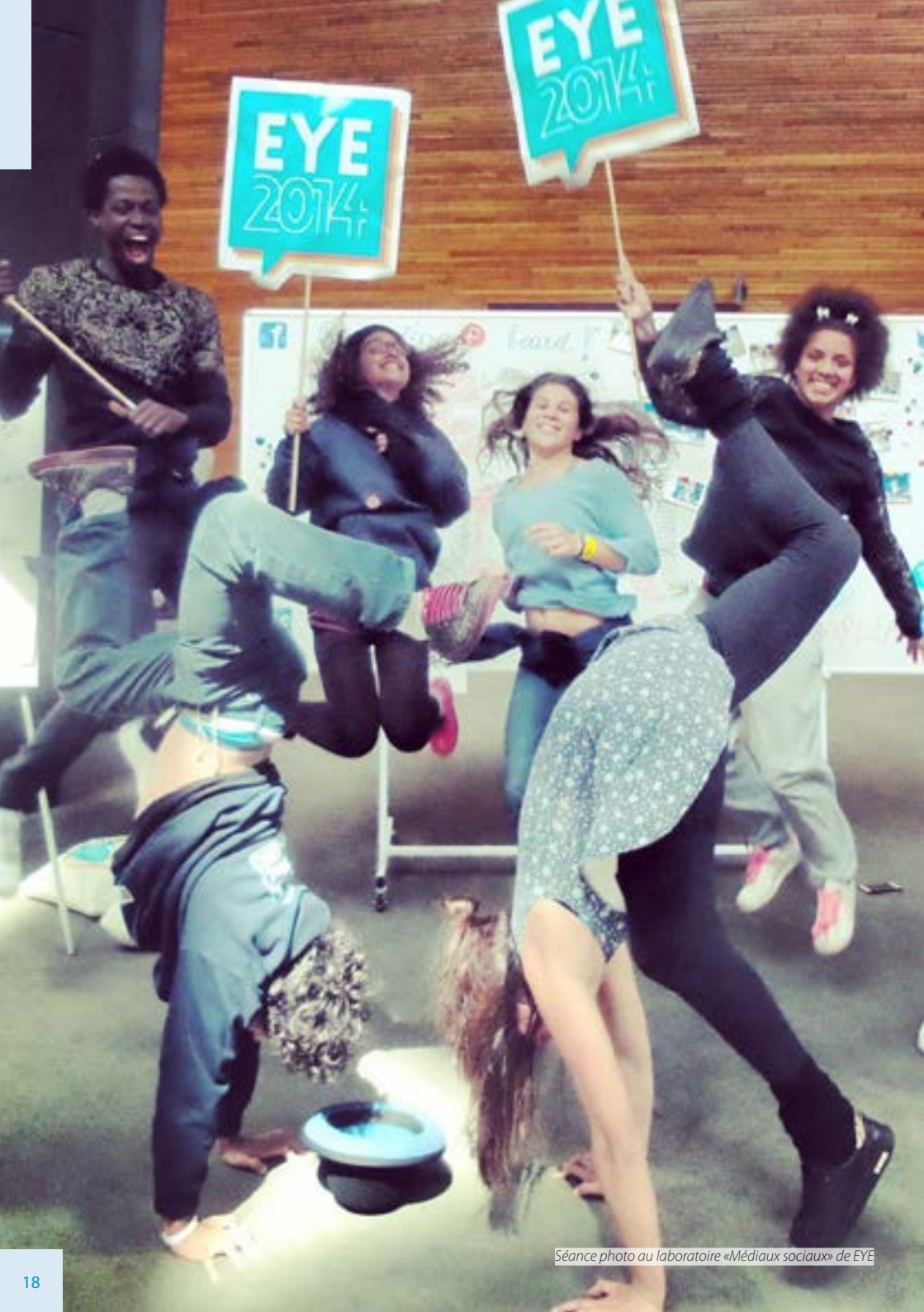
Séance photo au laboratoire «Médiaux sociaux» de EYE