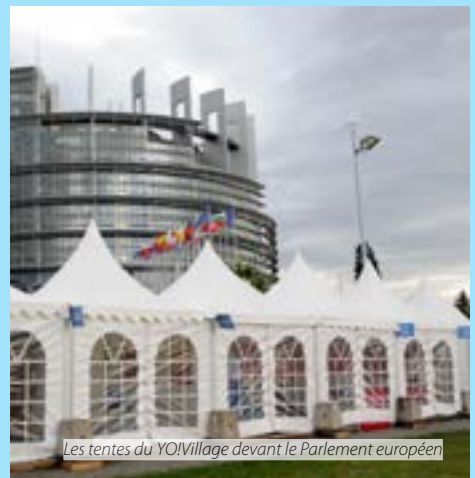
Les tentes du YO!Village devant le Parlement européen

Réaliser de réels progrès en matière de développement durable nécessite un changement radical dans la gestion des investissements et du commerce mondiaux. L'obligation de rendre des comptes et la responsabilité doivent être au cœur de tout modèle adopté, et la communauté mondiale