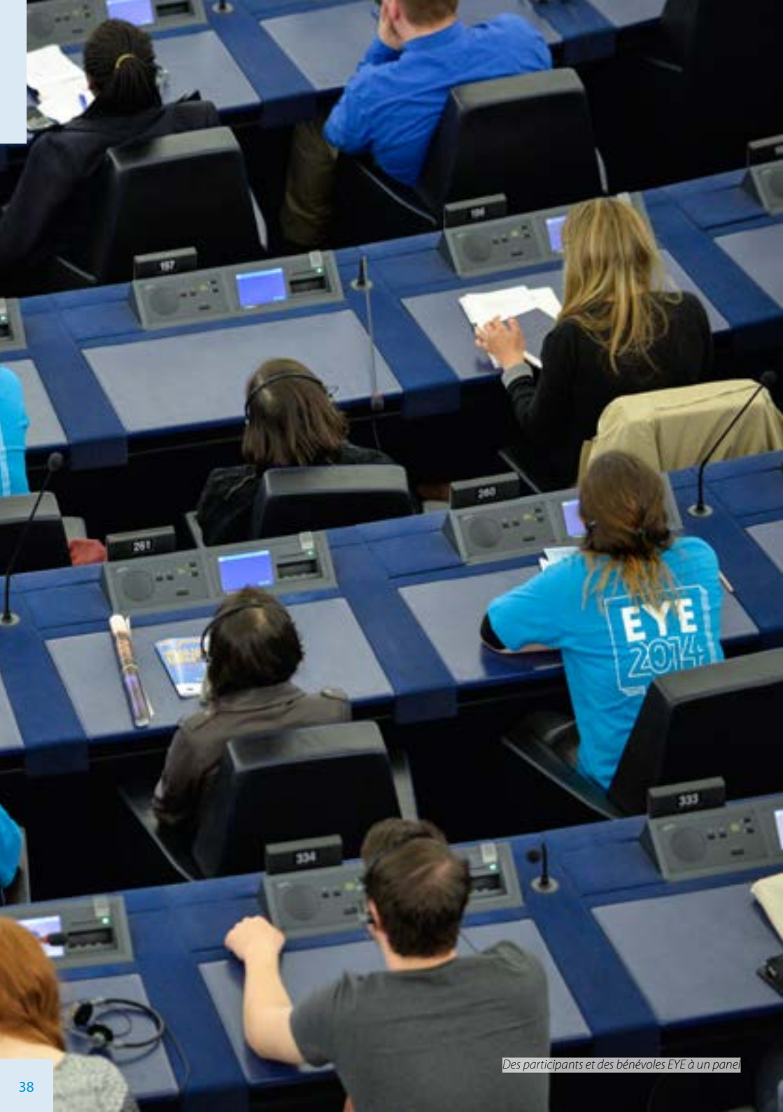
Des participants et des bénévoles EYE à un panel