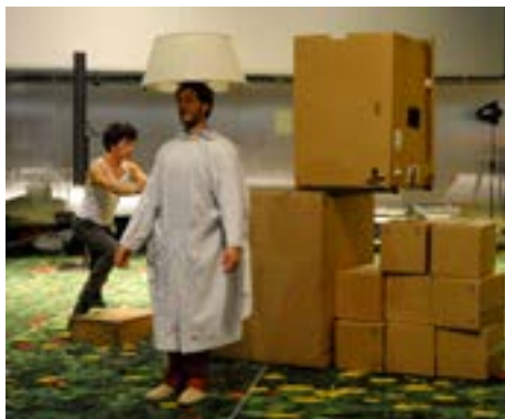
Un autre aperçu du spectacle de cirque au bar des fleurs

Lors d'une table ronde sur l'avenir de la pêche durable, les participants ont pris acte des récentes avancées législatives de l'Union, mais ont également évoqué les défis majeurs liés à la mise en œuvre et à l'efficacité d'une politique commune de l'Union, même si certains pays sont nettement plus concernés que d'autres. Les participants ont critiqué les groupes de pression puissants, qui ont récemment été à l'origine du rejet, à une faible majorité au Parlement, d'une proposition visant à interdire progressivement l'utilisation destructrice de chaluts de fond en eau profonde. Ils ont estimé, en outre, que cette question devrait être, à nouveau, inscrite à l'ordre du jour. Par ailleurs, de nombreux participants, notamment ceux originaires du sud de l'Europe, ont réclamé davantage de mesures incitatives et d'aides pour les pêcheurs de leurs pays, afin de leur permettre notamment de gagner leur vie grâce à la pêche de loisir. Ils ont estimé que les quotas et les règles excessives de l'Union portent préjudice à leurs communautés. Les intervenants et les participants ont tous plaidé pour une plus grande souplesse en matière de quotas, de manière à limiter les rejets de poissons en mer et pour des mesures d'incitation visant à diversifier le régime alimentaire européen, en y intégrant de nouvelles espèces de poisson.