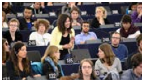
Prenant la parole au cours d'une session

de la rencontre EYE. L'une des conclusions principales de cette discussion était que les gros volumes de données constituent une sorte de nouvelle devise qui sert à régler une prestation de services; les utilisateurs ont un accès gratuit à des services de messagerie électronique ou de médias sociaux, mais donnent en échange leurs données personnelles. Selon Carl Fridh Kleberg, correspondant international auprès de l'agence de presse suédoise TT et participant à la table ronde,