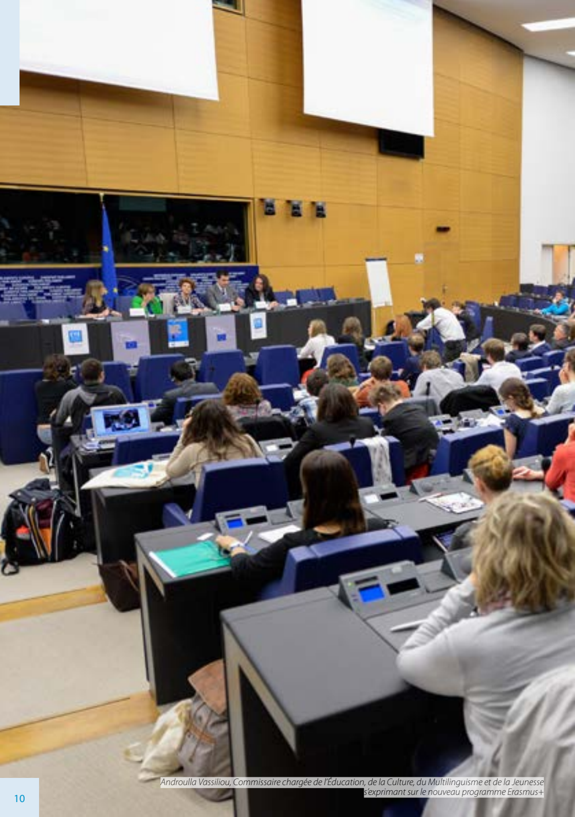
Androulla Vassiliou, Commissaire chargée de l'Éducation, de la Culture, du Multilinguisme et de la Jeunesse s'exprimant sur le nouveau programme Erasmus+