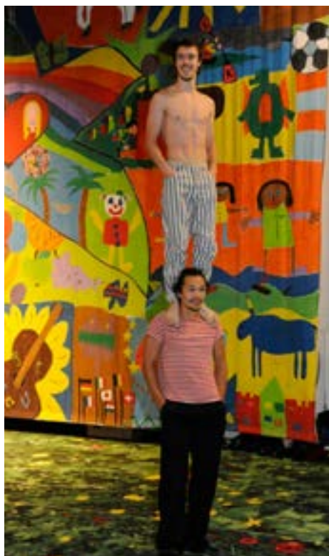
Deux artistes à la démonstration de cirque

«Je pense que nous pouvons résoudre tous les problèmes de discrimination que nous rencontrons grâce à l'éducation; il s'agit d'un