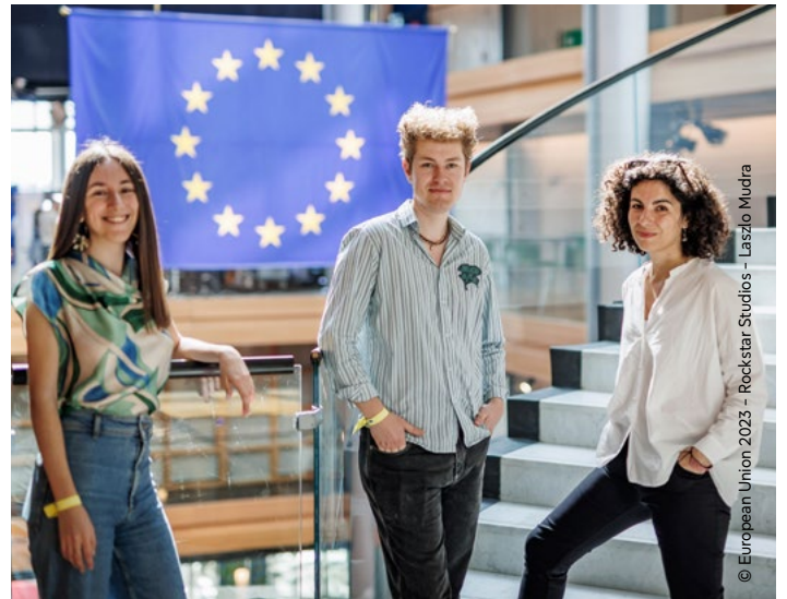
Redakce: Elena Manso Palao, Lukas O. Rastovic and Alessia Melchiorre.

Zpráva o námětech mladých lidí je završením cesty, která začala spolu s tímto rokem. Zahrnuli jsme do ní nápady, které vznikly jak na platformě youthideas.eu , tak na Evropském setkání mládeže (EYE2023) ve Štrasburku. Na této akci se ve dnech 9. a 10. června sešlo 8500 mladých lidí, aby sdíleli a utvářeli své názory na to, jak by Evropa v budoucnu měla vypadat.