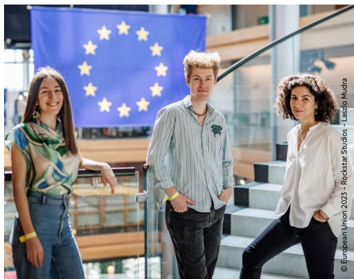
Redaktører: Elena Manso Palao, Lukas O. Rastovic og Alessia Melchiorre.

Denne femte udgave af arrangementet var særligt intens med mange meningsudvekslinger. Omkring 325 aktiviteter fandt sted i Europa-Parlamentet og i EYE-landsbyen. De bidrog alle til at få hver enkelt deltager til at føle sig hjemme i det europæiske demokratis hus.